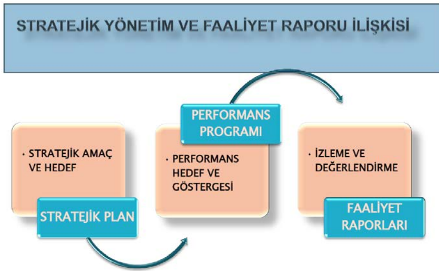
Şekil – 2: Stratejik yönetim ve faaliyet raporu ilişkisi

Performans verilerinin doğrulama yöntemleri stratejik planda belirlenmiş olup, her birim kendi bünyesinde bunun güvenilirliğini belirlemektedir. Harcama yetkilisi olan birim müdürlerinin iç kontrol güvence beyanları da faaliyet raporunda yer almaktadır.